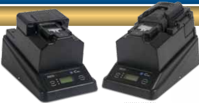
18108631-00 V-CAL SA VENTIS INSTRUMENTOM