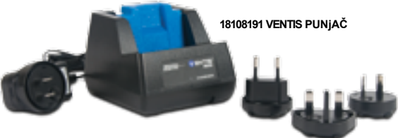
18108191 VENTIS PUNJAČ