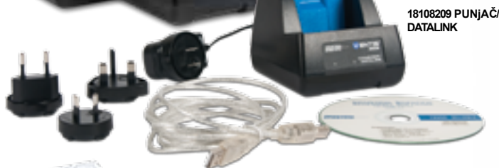
18108209 PUNJAČ/ DATALINK