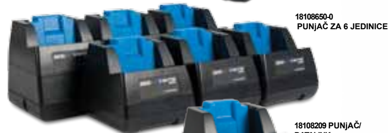
18108650-0 PUNJAČ ZA 6 JEDINICE